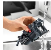
抽出ユニットは簡単に取り外して洗うことができます