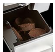
豆カスは自動的にカス入れに溜まるので捨てるのも簡単