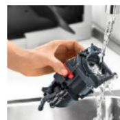
抽出ユニットは簡単に取り外して洗うことができます