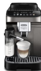
デロンギ マグニフィカ イーヴォ 全自動コーヒーマシン (ECAM29081XTB) 仕様表